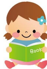
デイリープログラム (一例)

当事業所では理学療法士・作業療法士による個別療育、保育士・指導員による集団療育を通じて「できない」から「できた」へ「できた」から自信を持って「できる」に繋がられるようひとりひとりの個性にあわせて楽しく訓練が受けられるよう取り組んでいきます。